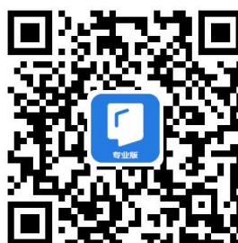
↑ 京东读书专业版 APP

京东读书专业版功能使用问题及资源需求反馈请联系“汇云书舍”微信公众号在线客服，24 小时免费答疑解惑。同时，汇云书舍每周定期推荐京东好书、新书，不定期举办京东阅读有奖活动，评选“阅读之星”。